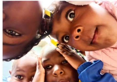
Besuch aus Namibia

Weitere Termine schon mal vormerken: 04.05.2025 22.06.2025